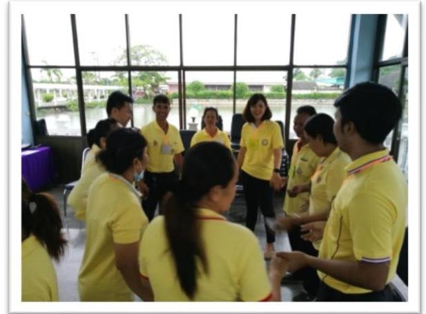
กิจกรรมร่วมด้วยช่วยกันเดาะ