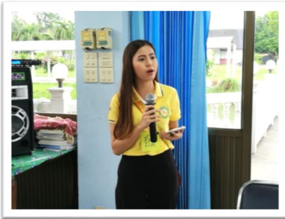
พิธีเปิดโครงการ